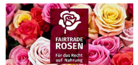
Plakat Rosenaktion © Fastenaktion / HEKS

5 Franken für eine Rose, gerne Barzahlung oder Twint