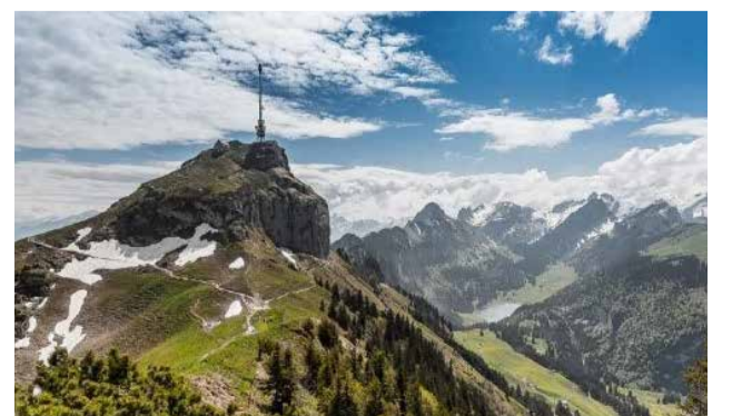
Hoher Kasten mit Drehhotel

Die Seniorenferien 2025 im Kirchentrio finden vom 10. – 13. Juni 2025 in Gais AR statt. Die Ausschreibung finden Sie auf unserer Webseite www.kirche-wichtrach.ch . Auskunft erhalten Sie bei Christina Campolongo, 079 778 98 53 oder ch.campolongo@kirchdorf.ch . Die Teilnehmerzahl ist beschränkt; Anmeldungen werden in der Reihenfolge des Eingangs berücksichtigt.