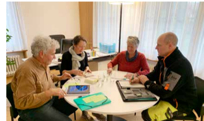
Mir si drannä