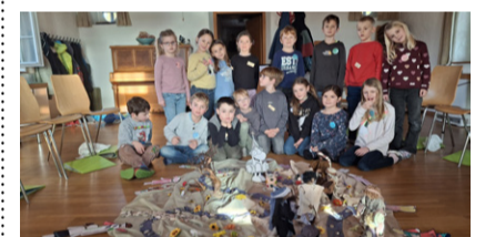
Bild: Bodenbild zur Taufe von Jesus