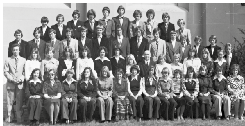
Am Palmsonntag vom 11. April 1976 wurden in der Kirche Kirchdorf konfirmiert: